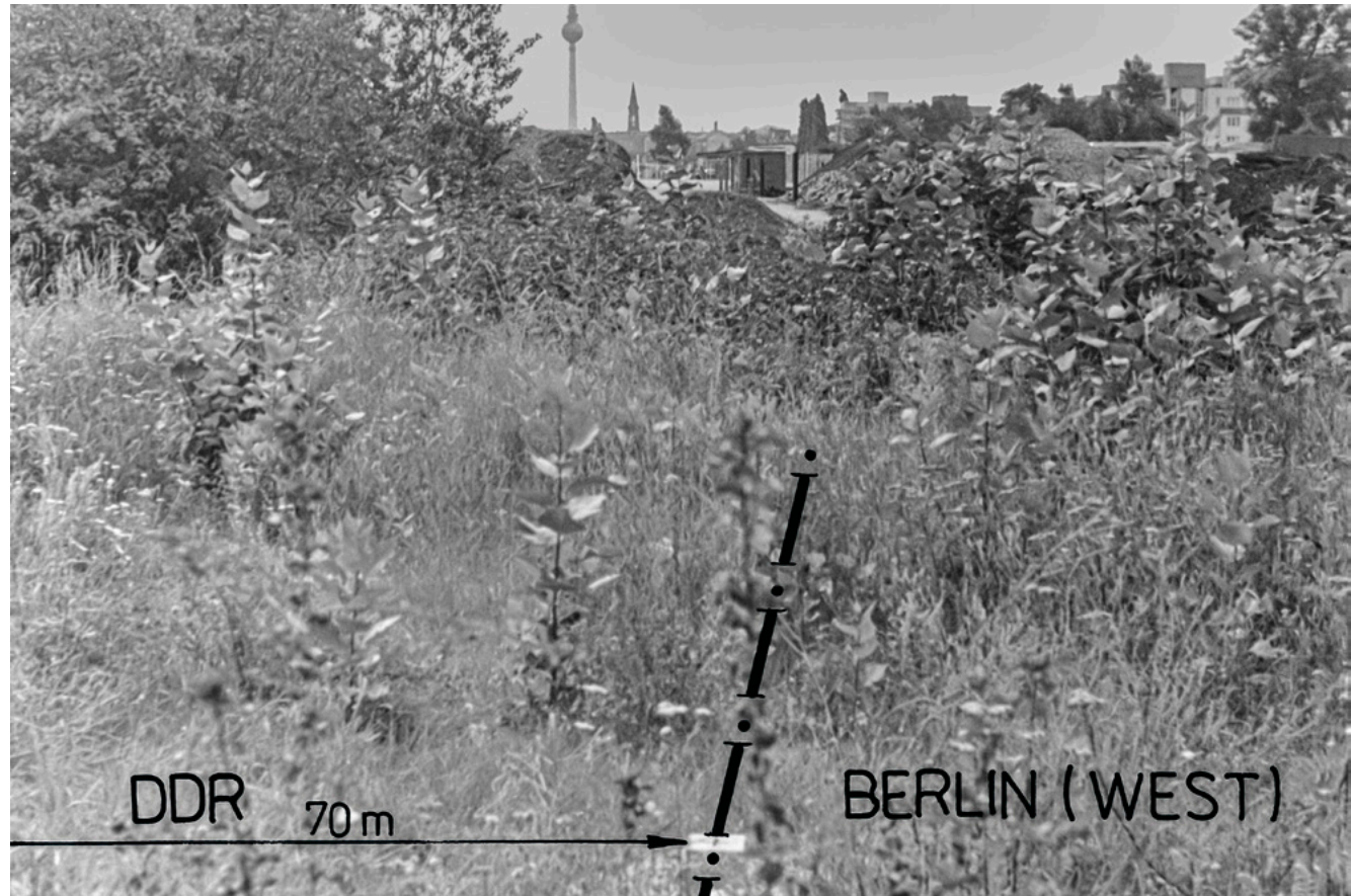
rechts des ehemaligen S-Bahntunnels Schönhauser Allee-Gesundbrunnen